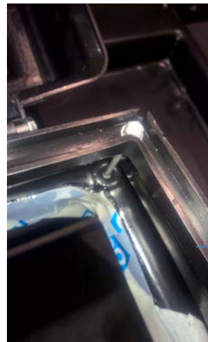
f. Kattoluukun kiinnitys pohjaosaan.