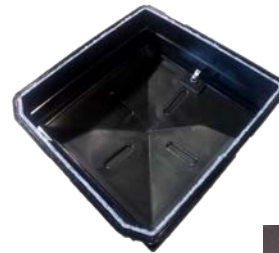
d. Tiivistemassaa kattoluukun pohjassa.