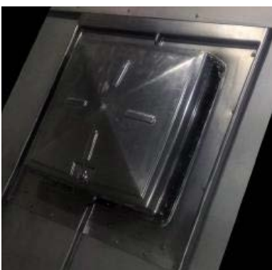
Kattoluukku asennettuna pystysaumakatteelle