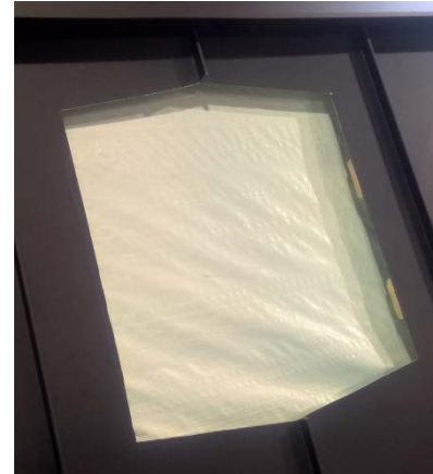
a. Aukko ja ruodelaudat leikattuina