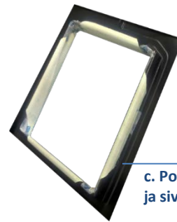
c. Pohjaosan korokkeeseen nurkista ja sivuilta teipattu aluskate.